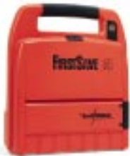
Defibrillatore AED FIRSTSAVE